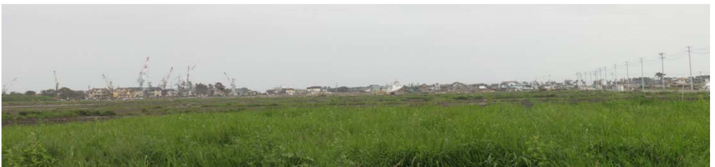
ボランティア本部から石巻湾方向を眺めた様子

ここから100m程海へ向かうと危険区域に指定されており、そこでは、警察と自衛隊の救助活動が行われていました。