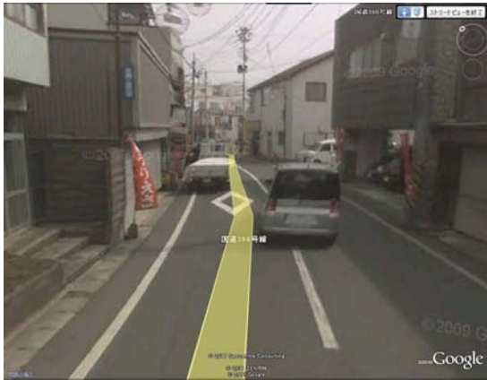
女川町立病院周辺

ここに、視察周辺の被災前の様子を、次項に視察スナップ写真と視察ルートを添付します。