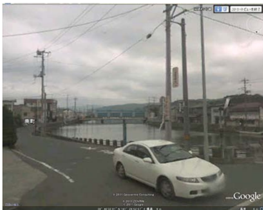
南三陸町役場周辺