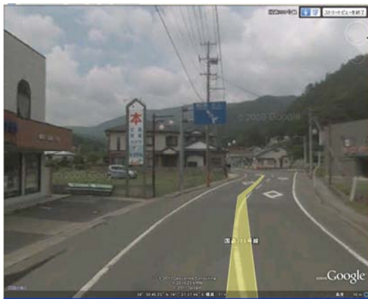
御勝町 石巻市立御勝中学校周辺